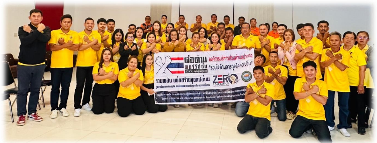
งานนโยบายและแผน สำนักปลัดองค์การบริหารส่วนตำบลปากท่อ ตำบลปากท่อ จังหวัดราชบุรี